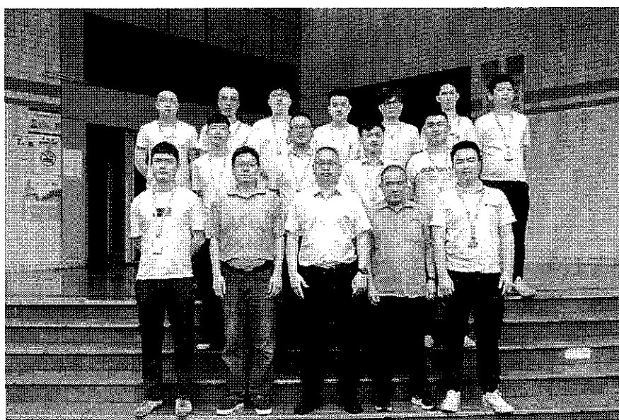
图 3 美团无人车配送业务骨干培训