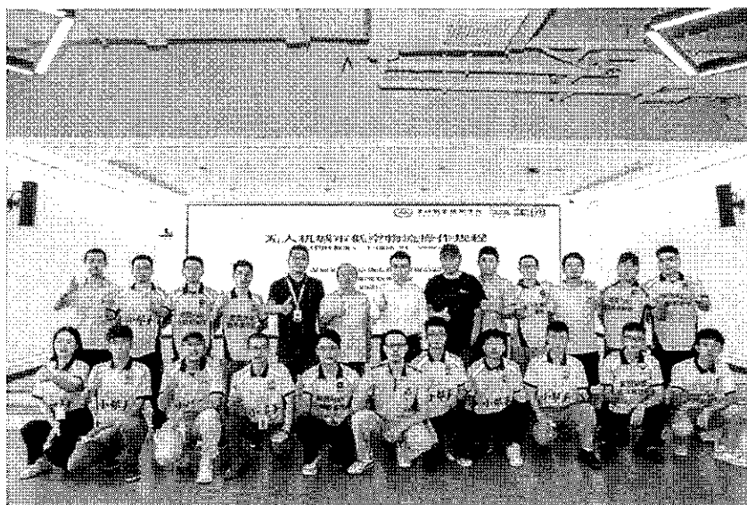
图 2 美团无人机配送业务骨干培训

程遥控、车辆运维、应急处置等系统知识与技能。后期这批员工，在深圳的多个社区、商场、写字楼的智慧园区开展无人车物流配送的相关业务。